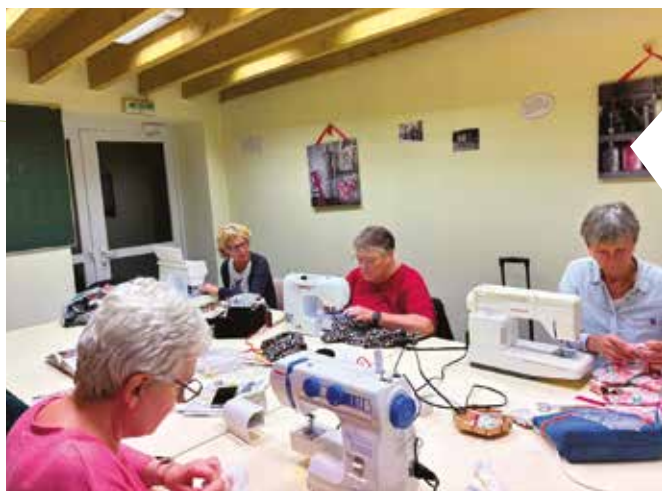
Les couturières en pleine action

Mail : association.nieuilcouture@laposte.net .