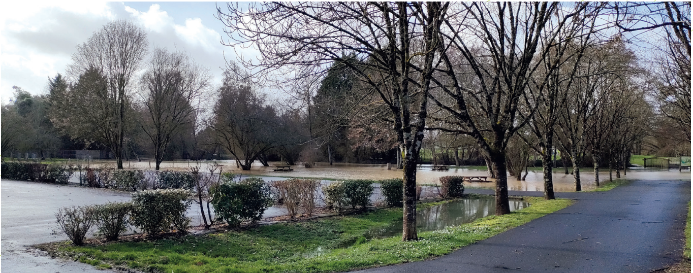
Parking des camping-cars inondé en février dernier.